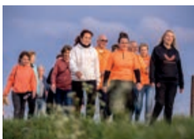
7 Polderloop voor het goede doel