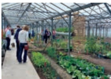
5 Open Dag Indoor Moestuintjes