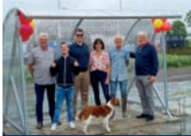
03 Nieuwe fietsenstalling voor Zorgkwekerij Maasdijs

Nummer 5 mei 2024 35 e jaargang www.maasbever.nl