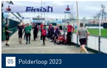
05 Polderloop 2023