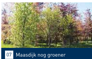
07 Maasdijs nog groener