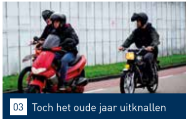
03 Toch het oude jaar uitknallen

Nummer 01 januari 2023 34 e jaargang www.maasbever.nl