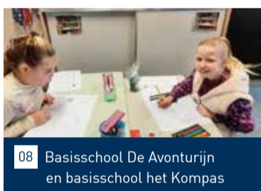
08 Basisschool De Avonturijn en basisschool het Kompas