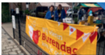
09 Burenmarkt bij Ons Buitenhuis