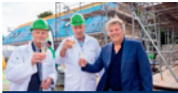
03 Eerste steen nieuwbouwproject

Nummer 8 september 2022 33 e jaargang www.maasbever.nl