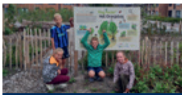
06 Tiny Forest op het Kompas