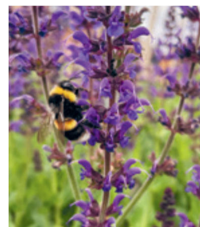
3e plek fotowedstrijd bij Lise