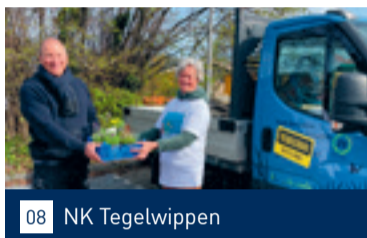
08 NK Tegelwippen