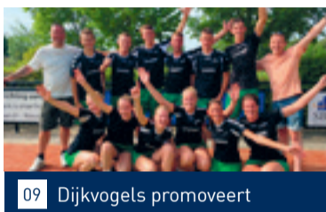
09 Dijkvogels promoveert