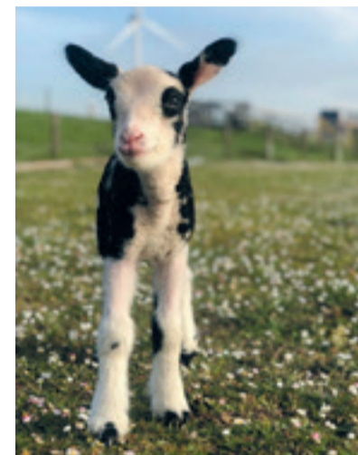
2e plek fotowedstrijd lammetje Liselotte