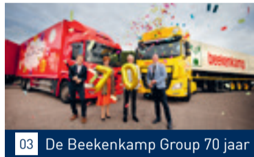
03 De Beekenkamp Group 70 jaar

Nummer 9 oktober 2021 32 e jaargang www.maasbever.nl