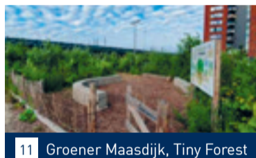
11 Groener Maasdijk, Tiny Forest