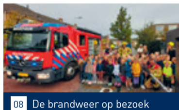
08 De brandweer op bezoek