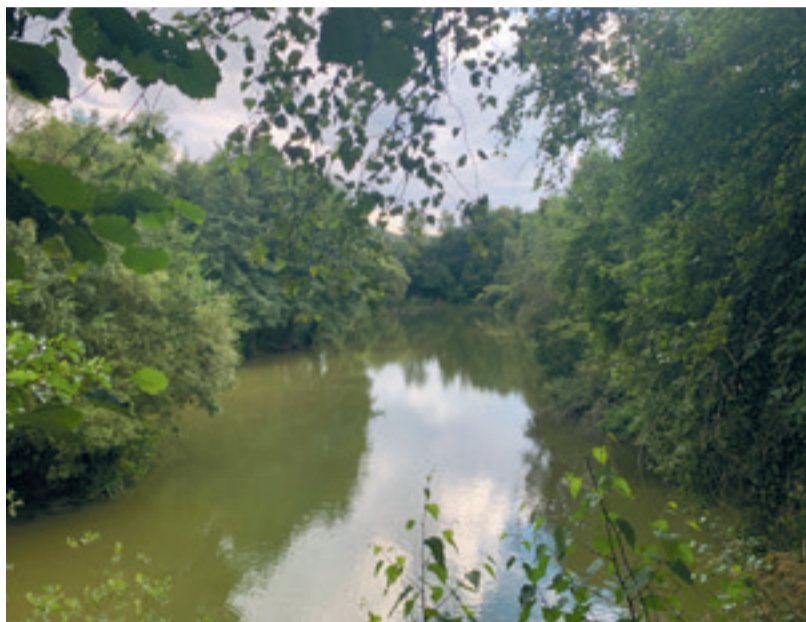
Een foto van de biotoop

Heb je nog vragen mail naar: groenermaasdijk@hotmail.com