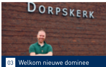
03 Welkom nieuwe dominee