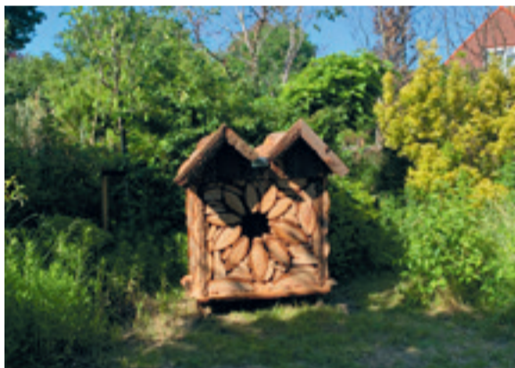
Insectenhotel aan de Lange Kruisweg 72