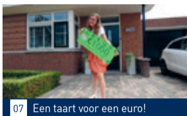
07 Een taart voor een euro!