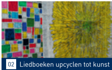
02 Liedboeken upcyclen tot kunst

Nummer 7 augustus 2021 32 e jaargang www.maasbever.nl