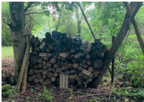
Een insectenhotel in de biotoop