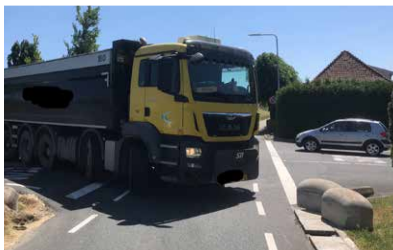
Een vrachtwagen maakt de bijna onmogelijke draai vanaf de afrit om het Onderpad op te draaien.