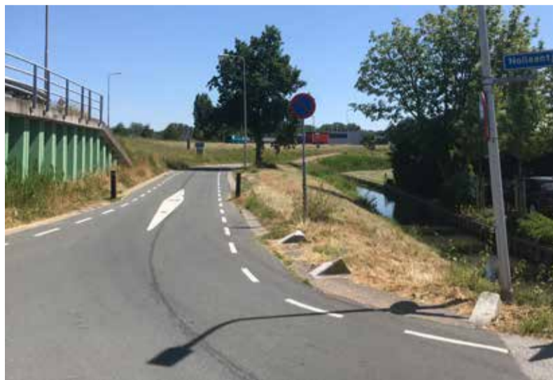
Het omstreden stuk 'Onderpad', ter hoogte van het Nollaantje

Bewoners van het Nollaantje ervaren veel overlast van verkeer (zowel personenauto's, busjes als vrachtwagens) dat het smalle laantje gebruikt om via het Onderpad en via de oprit ter hoogte van Tuincentrum Boers richting Coldenhove/A20 te rijden. De algemene verkeerssituatie in ons dorp en specifiek de situatie nabij het Nollaantje en het Onderpad langs de Maasdijk zijn door Roel Batelaan onder de aandacht gebracht bij het gemeentebestuur. Hij wil dat er nu eens spijkers met koppen worden geslagen.