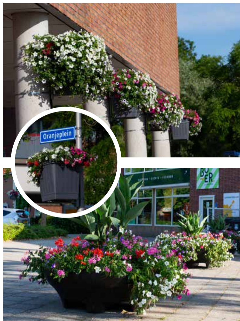
Het Oranjeplein is opgefleurd door fraaie bloembakken en aan de lantaarnpalen zijn hanging baskets opgehangen. Leuk!