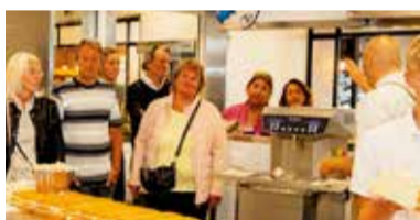
09 Bakkerij Vreugdenhil geeft ondernemers kijkje in de keuken