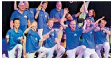
03 Slagwerkgroep Eendracht Maakt Macht 75 jaar

Nummer 06 mei 2023 34 e jaargang www.maasbever.nl