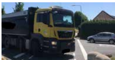
11 "Verkeersproblematiek Maasdijs vraagt om snelle aanpak!" keuken